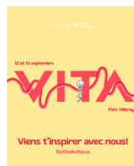
Atelier, kiosque ou initiation